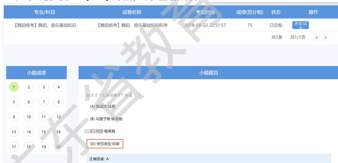
图【舞蹈统考】查看成绩界面