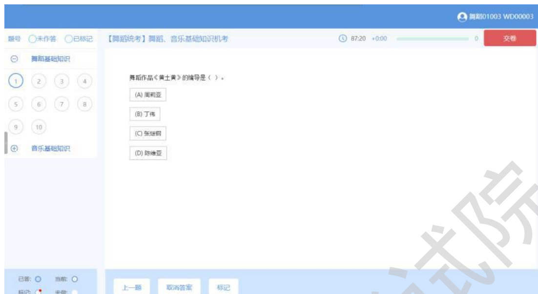
图【舞蹈统考】考试界面